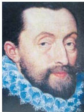
Petr Vok na portrétu z roku 1580.