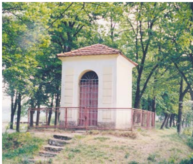
Kaplička Nejsvětější Trojice na Hůrkách.