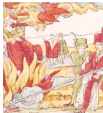
Poprava upálením. Německý dřevorez kolem roku 1555.