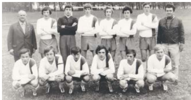
TJ ZVVZ Milevsko, žáci „A“ – vítěz Okresního přeboru skupiny B v sezóně 1972/1973.