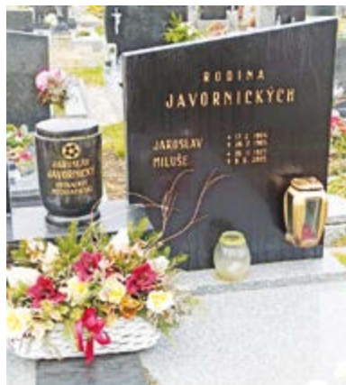
Rodinný hrob. Stav v roce 2024.