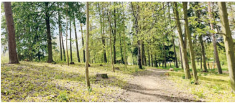
Údržba lesíku nad areálem SPOS.