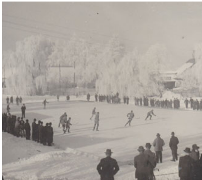
Hokejové utkání na rybníku Kuklík u Bažantnice před rokem 1940.