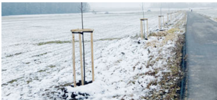
Liniová výsadba u obce Rukáveč.

V rámci běžné údržby, během plné vegetace, která spočívá v sečení travnatých ploch, tvarovacích řezech keřových skupin, závlivce výsadeb, pletí sezónních a smíšených výsadeb, jejich řezu a na konci sezóny pak končí úklidem listů. Odbor životního prostředí provádí v údržbě zeleně i další práce.