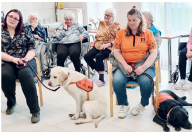
Beseda o terapeutických psech pro nevidomé.