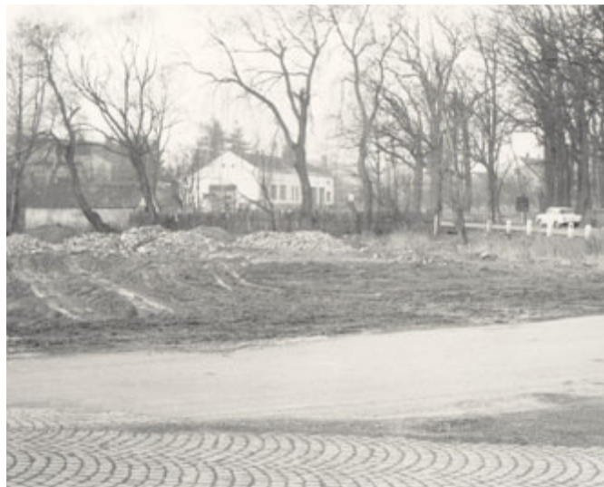
Konec jedné éry milevského hokeje na rybníku Kuklík. Snímek zachycuje již zasypaný rybník v souvislosti se stavbou přeložky silnice I/19 mimoúrovňové křižovatky na začátku sedmdesátých let 20. století. Lední hokej skončil na Kuklíku v sezóně 1955/1956, kdy se přestěhoval „Na Tržiště“.