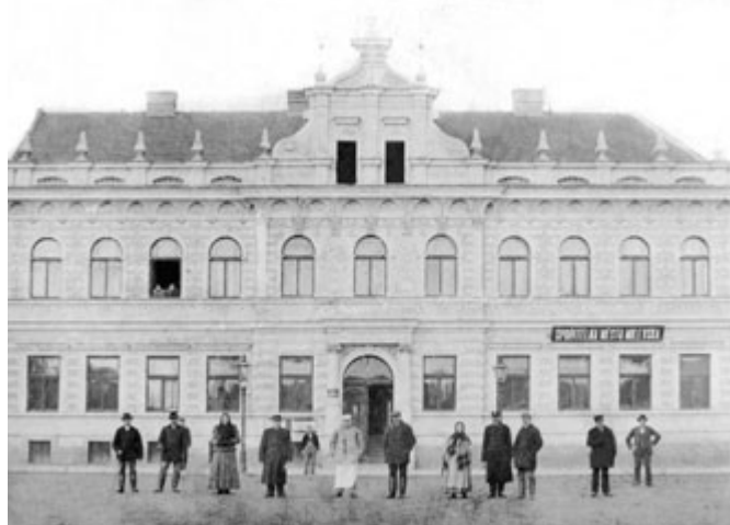
Nová radnice na milevském náměstí, foto před rokem 1910.