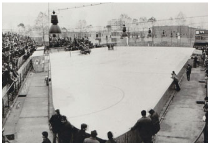
Slavnostní otevření zimního stadionu s umělým kluzištem – Milevsko 28. října 1972.